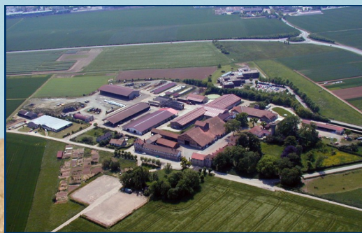
La ferme de Grignon, cadre du programme Grignon Énergie Positive, dans la plaine de Versailles

Téléchargez PerfAlim sur notre site: www.cereopa.com/fr/actions/perfalim.html ou www.cereopa.com (et sélectionnez PerfAlim)